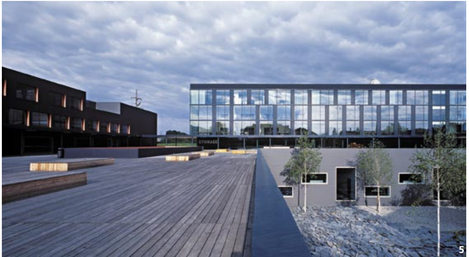
→ 5 Arbeit des Fotografen Thomas Jantscher: Centre scolaire de Marcelin, Morges, von Geninascia Delefortrie. www.gd-archi.ch