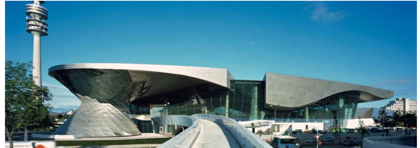
BMW Welt, München Architekt: Coop Himmelb(l)au Eröffnung: 10/2007